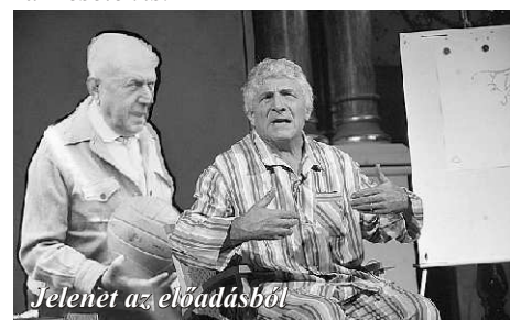
Jelenet az előadásból

reket szeretek játszani, akiket az élet furcsa helyzetekbe sodor. Mert a születés és a halál között nemcsak tragédiák történnek az egyszerű emberekkel, hanem furcsa és bizarr esetek is.”